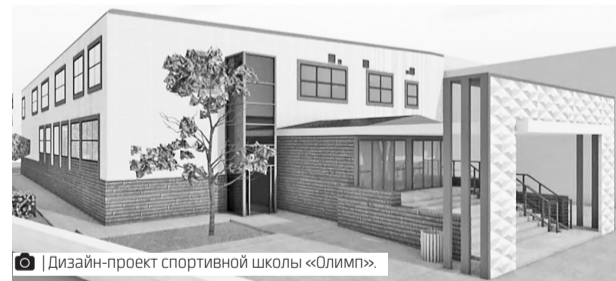
Дизайн-проект спортивной школы «Олимп».

В прошлом году в Губкинском модернизировали сразу две лыжных базы. В микрорайоне Пурпе базу построили с нуля, а на базе «Снежинка» – обустроили стрельбище для занятий пневматическим биатлоном.