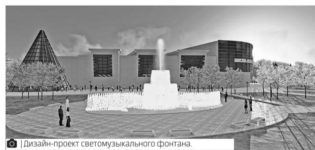
Дизайн-проект светомузыкального фонтана.

В рамках реализации программы «Комфортная городская среда» в 2023 году в Губкинском планируется благоустроить 13 объектов. Один из них – светомузыкальный фонтан. Также в городе будут обустроены четыре детских игровых комплекса, две спортивно-игровые площадки, шесть скверов и одна зона отдыха.