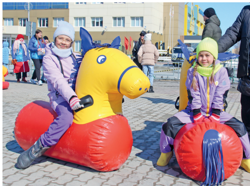
Детвору на празднике приглашали принять участие во множестве подвижных игр и конкурсов.