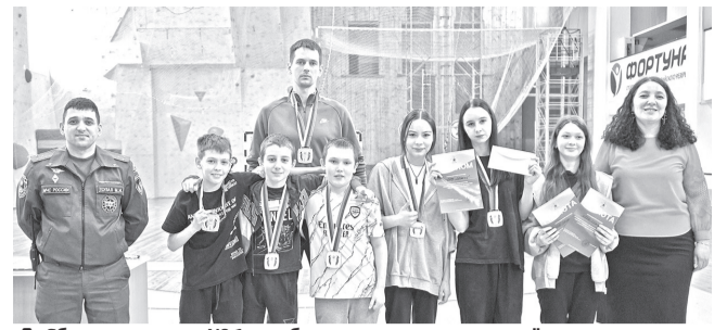
Сборная школы № 1 – победители городского слёта-соревнования «Школа безопасности».

Все ребята хорошо справились с заданиями. В итоге места распределились следующим образом: первое место заняли ученики школы № 1, второй результат показали учащиеся школы № 3, тройку лидеров замкнула команда школы № 4.