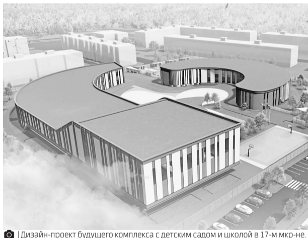
Дизайн-проект будущего комплекса с детским садом и школой в 17-м мкр-не.

В 2022 году в социальной сфере Губкинского был выполнен рекордный объём строительных работ. Всего отремонтировали 21 учреждение. Планы по ремонту на 2023-й тоже масштабные. Ремонт пройдёт на 17 объектах.