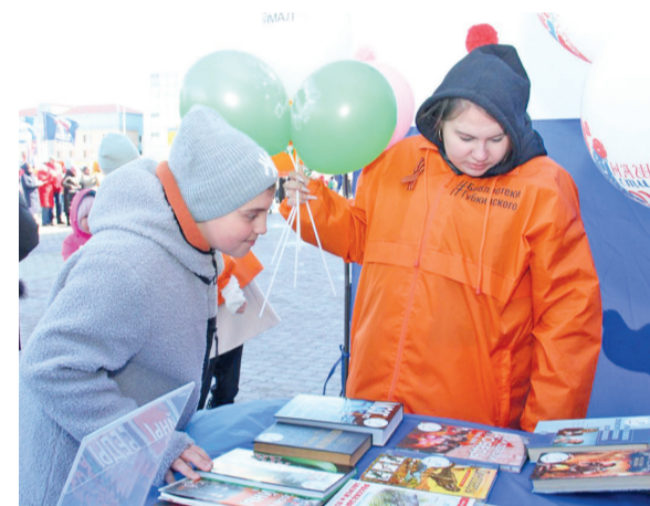
Акция «Книговорот» привлекла губкинских читателей литературой на любой вкус.