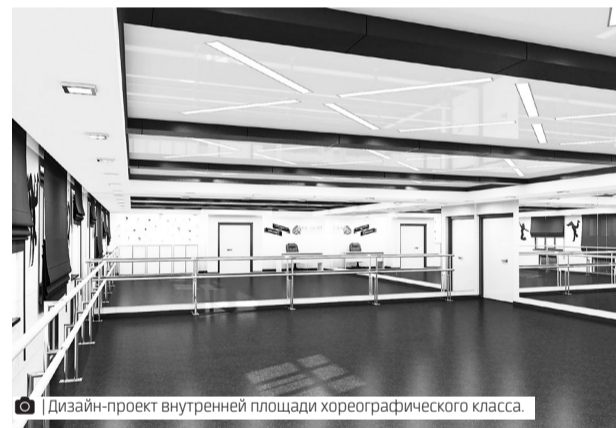
Дизайн-проект внутренней площади хореографического класса.

В городе сразу в двух учреждениях культуры проходит масштабный ремонт. Оценить новую детскую модельную библиотеку юные губкинцы смогут уже в августе. Здание преобразят по модельному стандарту. Новый эстетичный вид приобретает здание Дома культуры «Олимп». Внутри увеличится площадь хореографического класса и театральной студии. В кинозале будут стильный дизайн, качественный звук, яркое изображение и 168 новых посадочных мест.