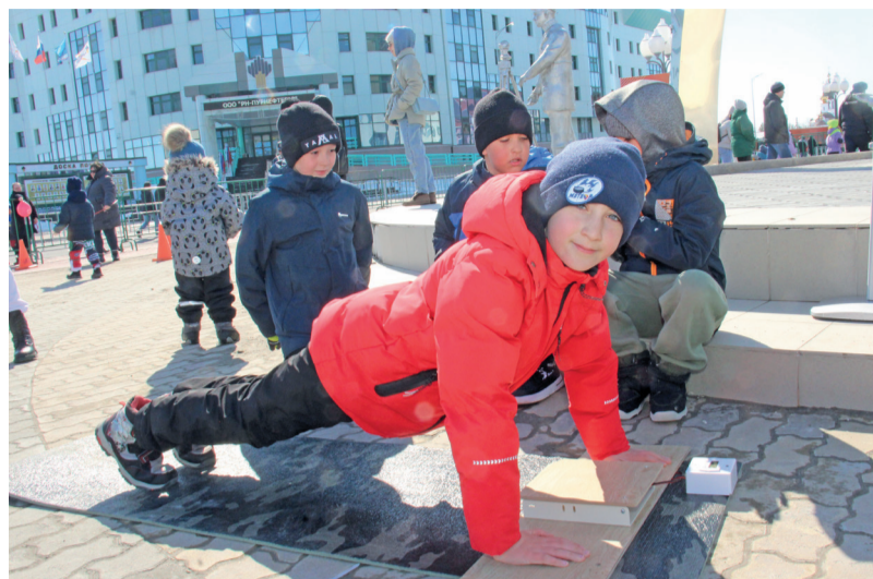
Многочисленные участники Всероссийской акции «Рекорд Победы» в праздничный день выполнили более тысячи отжиманий.

На концерте выступили звёзды централизованной клубной системы города, в том числе народный хор «Родные напевы», вокальный ансамбль «Шатлык», народный хор «Жемчужина Ямала» и др.