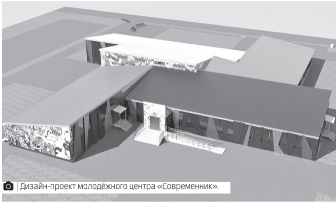
Дизайн-проект молодёжного центра «Современник».