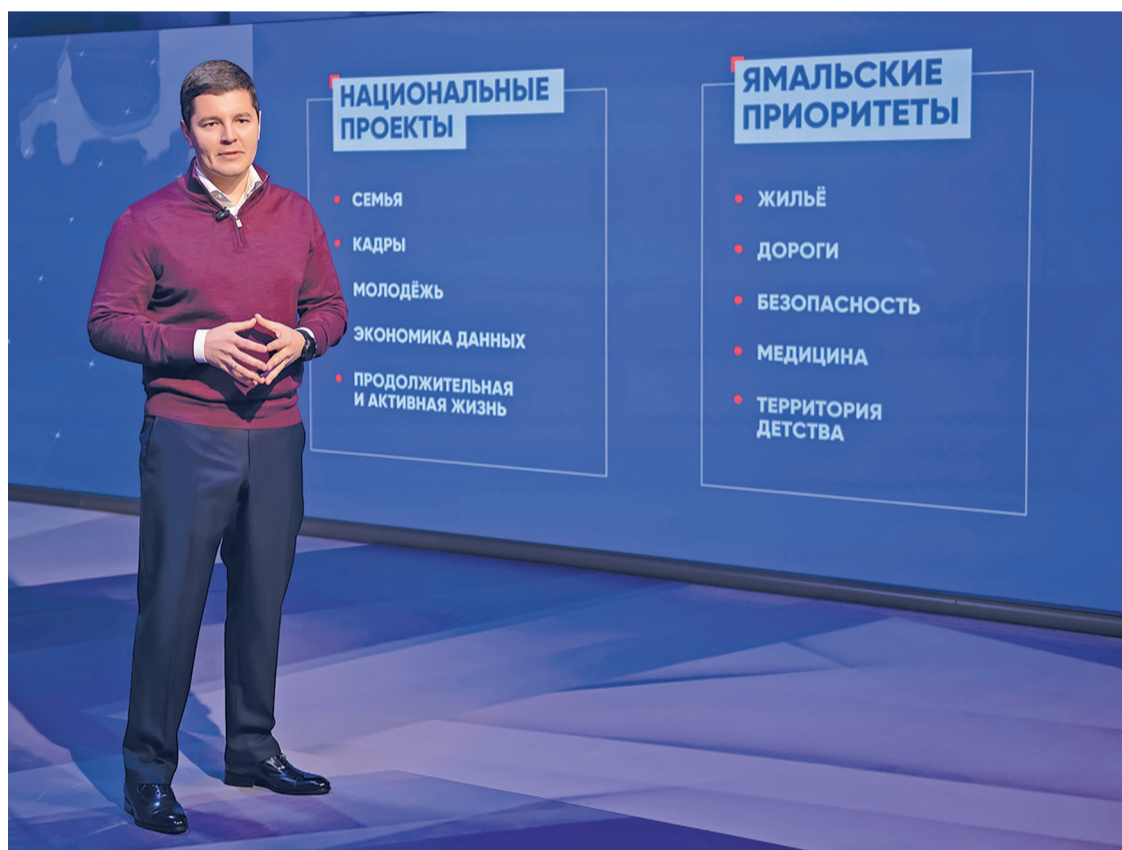
В ежегодном докладе Дмитрий Артюхов рассказал об основных решениях Ямала, которыми в регионе усилят новые национальные проекты.

Расселили почти 700 000 м 2 , новые условия для жизни получили более 25 000 семей. Объём ежегодно вводимых под переселение квартир за пять лет нарастили вдвое. Не сбавим темпа и в ближайшие два года. Именно за это время завершим большую про-