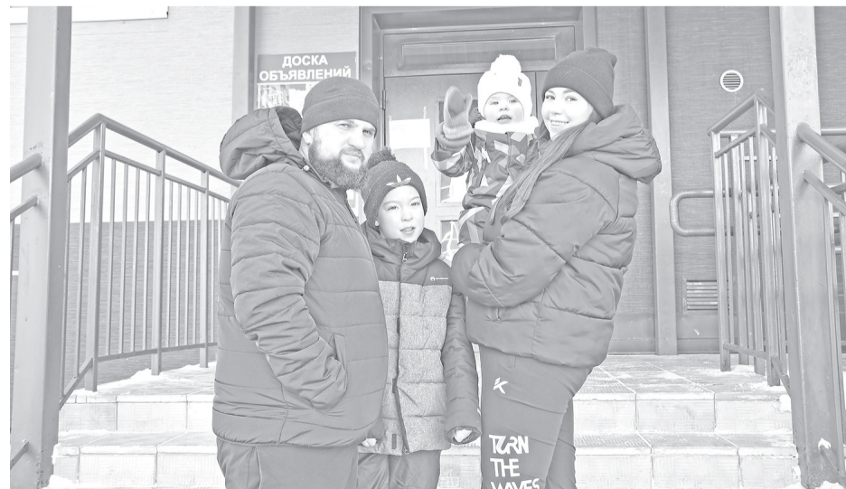
❖ По программе переселения из аварийного фонда губкинцы получили однокомнатную квартиру в 9-м микрорайоне.

До 2025 года в регионе планируется расселить 1 миллион квадратных метров ветхого жилья. Эту приоритетную задачу губернатор ЯНАО Дмитрий Артюхов впервые озвучил в 2019 году, и темпов по достижению поставленной цели округ не снижает. За пять лет на Ямале расселили более 41 000 жителей. Мероприятия реализуются в рамках национального проекта «Жильё и городская среда».