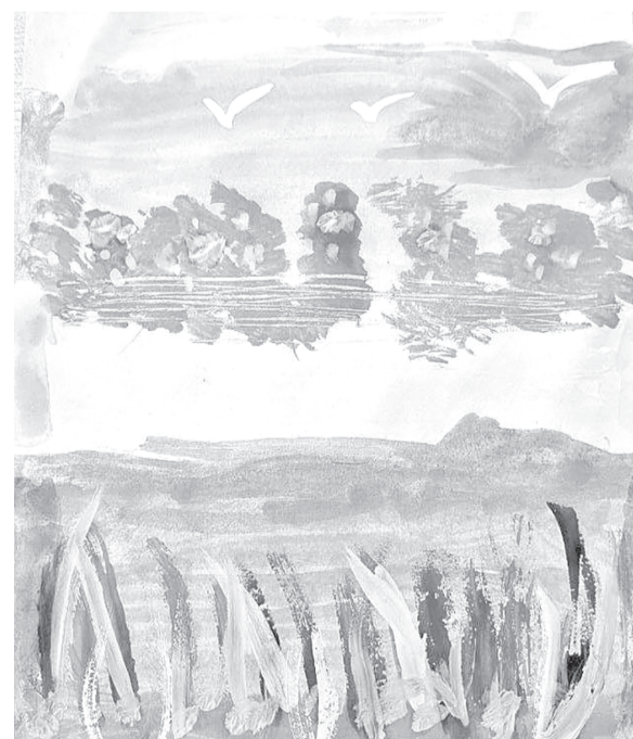
📷 Арт-терапия раскрывает творческий потенциал учащихся и улучшает их эмоциональное состояние.