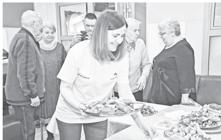
❖ Волонтеры «СевКомНефтегаза» организовали сладкий стол для гостей праздника.

посещают более 100 пенсионеров, инвалидов и детей с ограниченными возможностями здоровья. Всего в округе работают 12 государственных организаций социального обслуживания. В 2023 году поддержку получили более 11 000 человек. В учреждениях ямальцам оказывают развивающие и оздоровительные услуги, проводят социальную реабилитацию, помогают в сложных жизненных ситуациях.