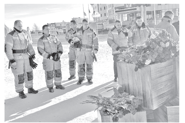
Губкинские пожарные одними из первых возложили цветы в память о жертвах трагедии.