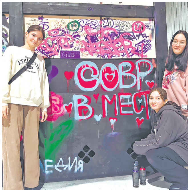
Новая стена для граффити уже пользуется большой популярностью у губкинской молодёжи.

Добавим, что в новом сквере в 11-м микрорайоне, напротив ТЦ «Меркурий», будет оборудована ещё одна стена для граффити. Сквер обустраивают в этом году в рамках федерального проекта «Формирование комфортной городской среды» национального проекта «Жильё и городская среда».