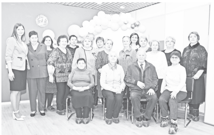
❖ Поздравить центр с открытием пришли губкинские ветераны и общественники.