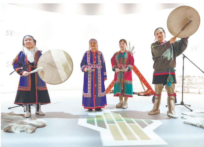
Выступление исполнителей национальных песнопений.

Гости павильона выигрывали призы, участвуя в увлекательных конкурсах и викторинах, посвящённых добыче нефти, традициям народного праздника Масленицы, а также самобытным традициям жителей тундры. Уникальные природные ландшафты автономного округа посетители увидели на выставке фоторабот сотрудинок ямальских предприятий «Роснефти».