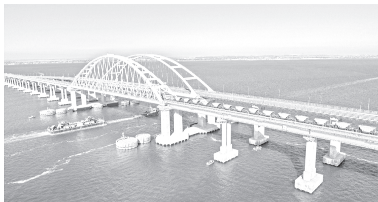
19-километровый Крымский мост через Керченский пролив – символ воссоединения Крыма с Россией.

Крымский полуостров и город федерального значения Севастополь стали частью России после проведенного 16 марта 2014 года референдума, на котором большинство их жителей высказались за вхождение в состав нашей страны. Множество крымчан на протяжении длительного времени выражали желание вернуться в Россию, а кризис украинской власти привёл к многочисленным митингам на полуострове. В феврале 2014 года после свершившегося госпереворота в Киеве Верховный Совет Крыма обратился к президенту России Владимиру Путину с просьбой включить республику в состав РФ, а спустя