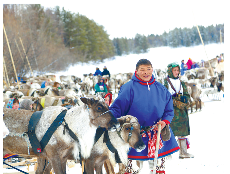
Гонки на оленьих упряжках и соревнования по национальным видам спорта – неотъемлемая часть праздника.

ПО ИНФОРМАЦИИ ПРЕСС-СЛУЖБЫ ООО «РН-ПУРНЕФТЕГАЗ»