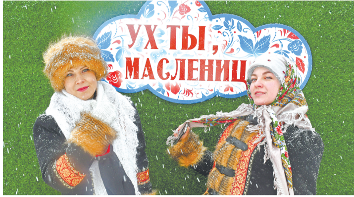
Развлекательную программу для губкинцев подготовили специалисты управления культуры города.