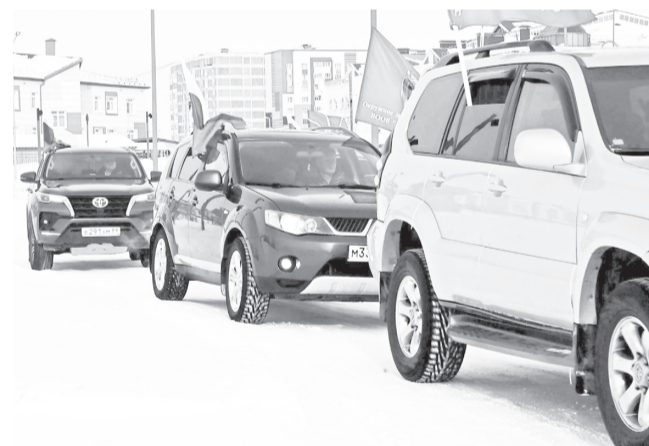
На приглашение к заезду губкинцы откликнулись моментально!