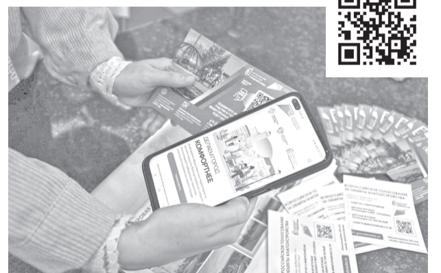
Проголосовать за территорию для благоустройства в 2025 году можно на сайте 89.gorodsreda.ru .

Ямал традиционно входит в число регионов с высокой активностью голосования. Всероссийское голосование проводится ежегодно в рамках федерального проекта