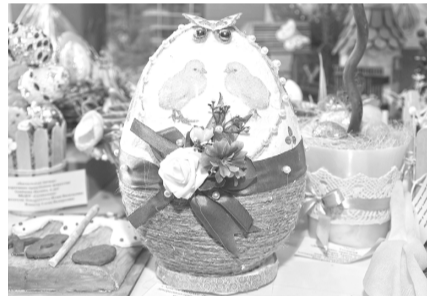
Более 670 творческих работ поступило на конкурс «Пасхальный вернисаж» в прошлом году!

Городской конкурс «Пасхальный вернисаж» уже в 12-й раз подарит губкинцам возможность продемонстрировать свои таланты. В этом году он проходит с 17 марта по 20 апреля. Работы участников будут принимать в воскресной школе 19 и 20 апреля, а 24 апреля объявят итоги конкурса.