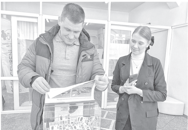
Губкинцы активно голосуют за новые объекты благоустройства.

Горожанам предлагают на выбор четыре проекта для реализации в 2025 году. Среди них два сквера – в Пурпе