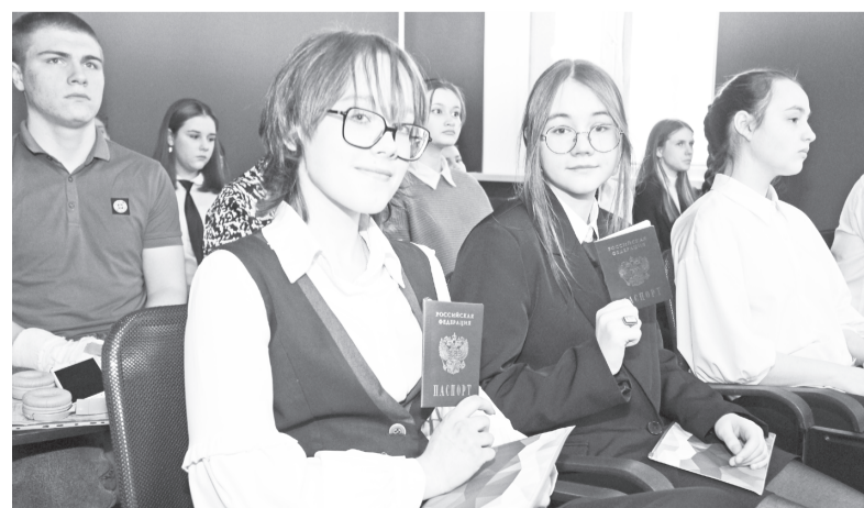
Получение паспорта – значимое событие в жизни каждого подростка.