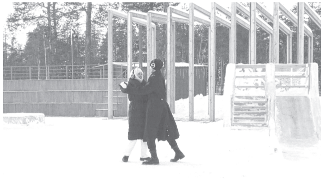
В спектакле-променаде задействованы 5 актёров.

Проект централизованной библиотечной системы города по созданию иммерсивного спектакля реализован на средства гранта Президентского фонда культурных инициатив. Впервые спектакль состоялся в феврале прошлого года. За год его увидели 147 человек. Сегодня те, кто желает совершить необычный променад по городу, могут обратиться в центральную библиотеку. Спектакль проводится каждую субботу, начинается в полдень и длится около часа.