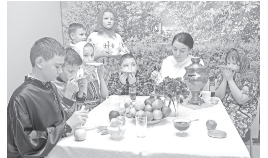
Ученики 2-й школы воссоздали картину Николая Богданова-Бельского «Именины учительницы», написанную в 1910 году.