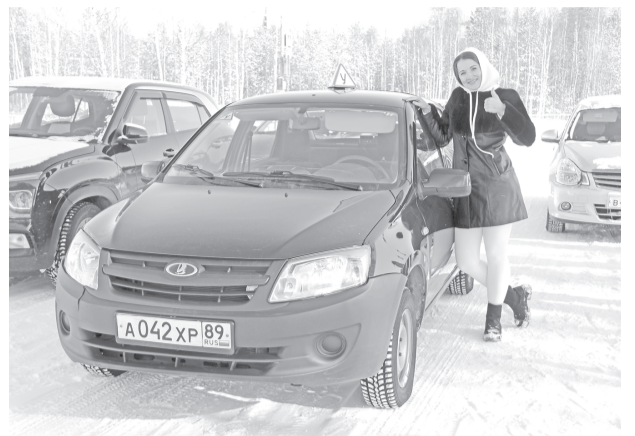
На автодроме после выполнения практического задания.