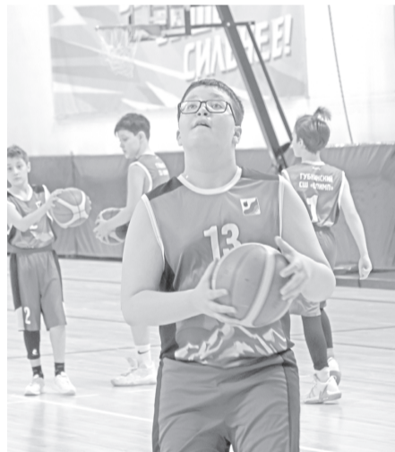
На соревнованиях по баскетболу среди школьниц команд.

Добавим, что на этой неделе в спортивном комплексе «Нефтяник» завершились соревнования среди мальчиков – учащихся 5–6-х классов, победу одержали лицеисты, на II месте – сборная спортшколы «Олимп», на III – команда 4-й школы. Также прошли соревнования между девочками – учащимися 2–4-х классов. I место – у сборной 4-й школы, II место заняла команда 7-й школы, на III месте – лицеистки.