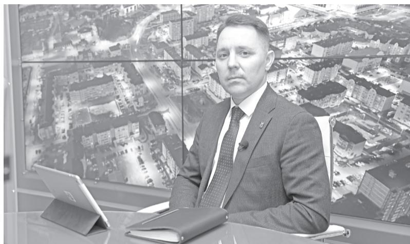
Глава города Андрей Бандурко.

Горожане задавали много вопросов о переселении из аварийного фонда. 7-й микрорайон на сегодняшний день расселён на 70%. Переселение осуществляется в новостройки 15-го и 17-го микрорайонов. В 7-м микрорайоне до 2028 года будет построен жилой комплекс с малоэтажными зданиями. Расселить 3-й микро-