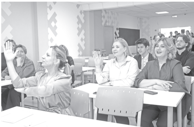
В 12-м «Ё» классе роль учащихся исполняли педагоги школы. | Фото: Анжела Белкина, ГТРК «Вектор».