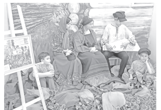
Учащиеся 4-й школы познакомили посетителей выставки с картиной «Летний день» Николая Богданова-Бельского, созданной в 1934 году.