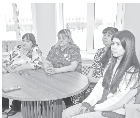
Главными гостями на встрече стали матери и жёны участников специальной военной операции.

В завершение встречи работники школьной столовой угостили всех присутствовавших настоящей солдатской кашей.