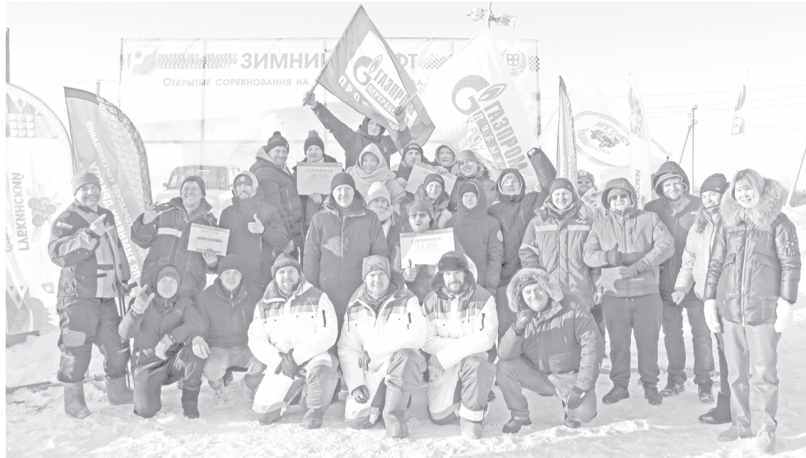
Участниками соревнований по зимнему дрейфу на кубок главы Губкинского стали 25 любителей экстремального вождения из Тюмени, Тарко-Сале, Ноябрьска, Нового Уренгоя и Губкинского.

В минувшие выходные прошли открытые соревнования по зимнему дрейфу на кубок главы Губкинского.