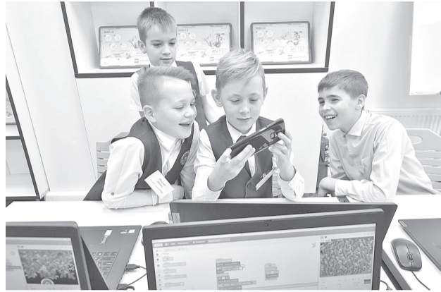
Современные технологии помогают учащимся осваивать новые знания. | Фото из открытых интернет-источников.

По окончании обучения детям выдают именные сертификаты и дипломы. По некоторым направлениям эти документы помогают поступить в вузы и прибавляют баллы к ЕГЭ.