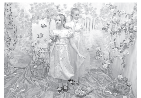
Картину «В розовом саду» Константина Разумова, написанную в 2018 году, воссоздали лицеисты.

Добавим, что проект «Выставка живых картин» реализуется в нашем городе на протяжении 8 лет. Уникальную муниципальную практику оценил во время одного из приездов и губернатор ЯНАО Дмитрий Артюхов .