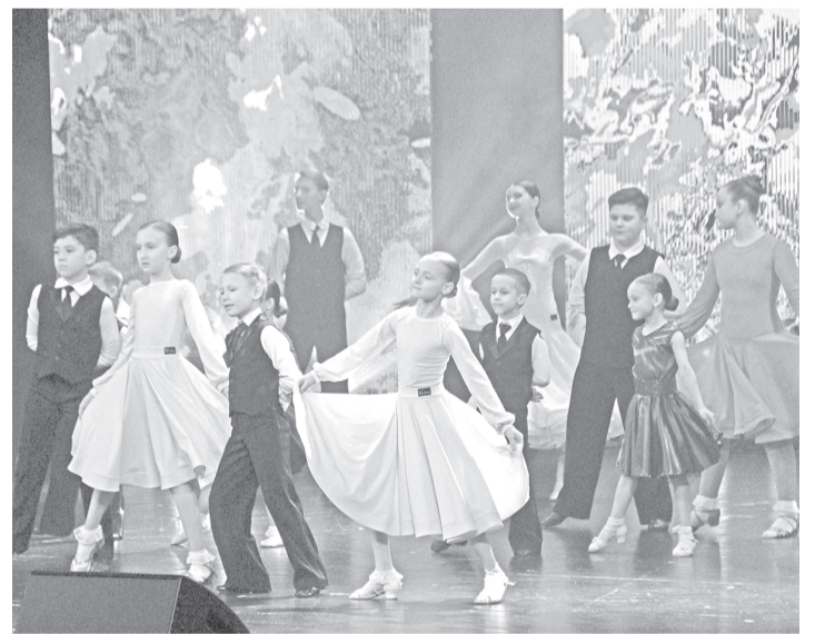
Яркое выступление участников ансамбля спортивного бального танца «Виктори-Денс».

Концерт, включающий вокальные, инструментальные и хореографические номера, зарядил зрителей положительными эмоциями и вызвал улыбки на их лицах. На сцене выступили творческие коллективы и солисты ЦКС г. Губкинского и ГДШИ им. Г. В. Свиридова. Праздничное мероприятие состоялось в рамках ямальской Недели женщин. Подобные тематические недели проводятся в рамках стратегии развития «Ямал-100» под эгидой Всероссийского проекта «Всей семьёй».