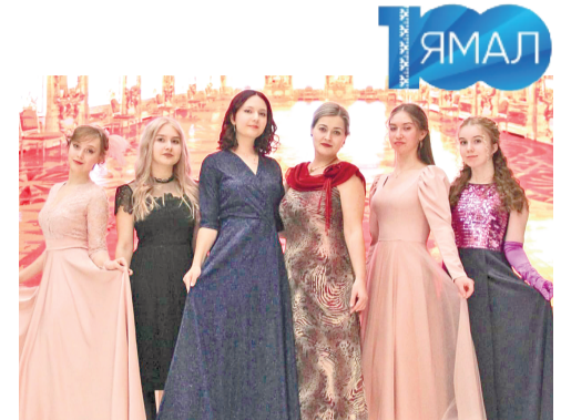
Девушки удивляли яркими вечерними нарядами.

знаменитые танцы: полонез, менуэт, вальс знакомств. Ученики школы № 4 показали знания в молодёжной игре «Что? Где? Когда?», соревнуясь за кубок клуба интеллектуальных игр «Полярная сова». В эту пятницу в молодёжном центре «Современник» пройдёт самое красивое мероприятие – творческий вечер «Мисс Весна – 2024». На нём прекрасные девушки в возрасте от 18 до 35 лет представят свои визитные карточки, таланты и интеллект. Также для девушек приготовлено секретное задание. Конкурс завершится гала-концертом «Мисс Весна – 2024», на котором будут вручены призы победительницам. Кроме того, 16 марта в 19:00 на территории роллер-парка «СКВ» пройдёт турнир, на котором райдеры парка и губкинцы смогут посоревноваться в экстремальной езде и трюках.