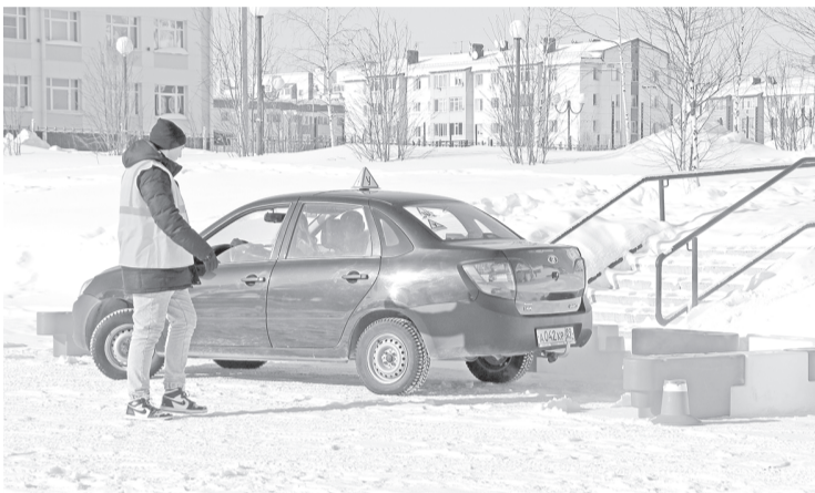
Параллельная парковка в исполнении одной из автоледи.